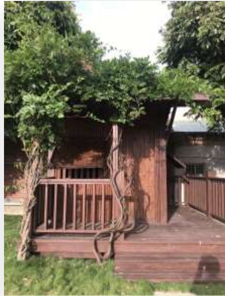
仿平埔族建造的 姑娘房