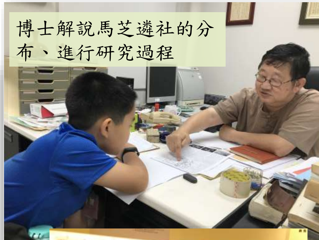
博士解說馬芝遴社的分布、進行研究過程