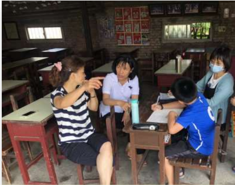
訪問大有村長夫人和社區 發展協會工作人員