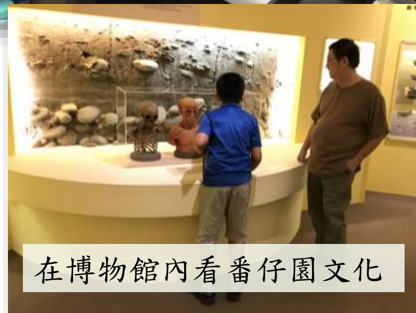
在博物館內看番仔園文化