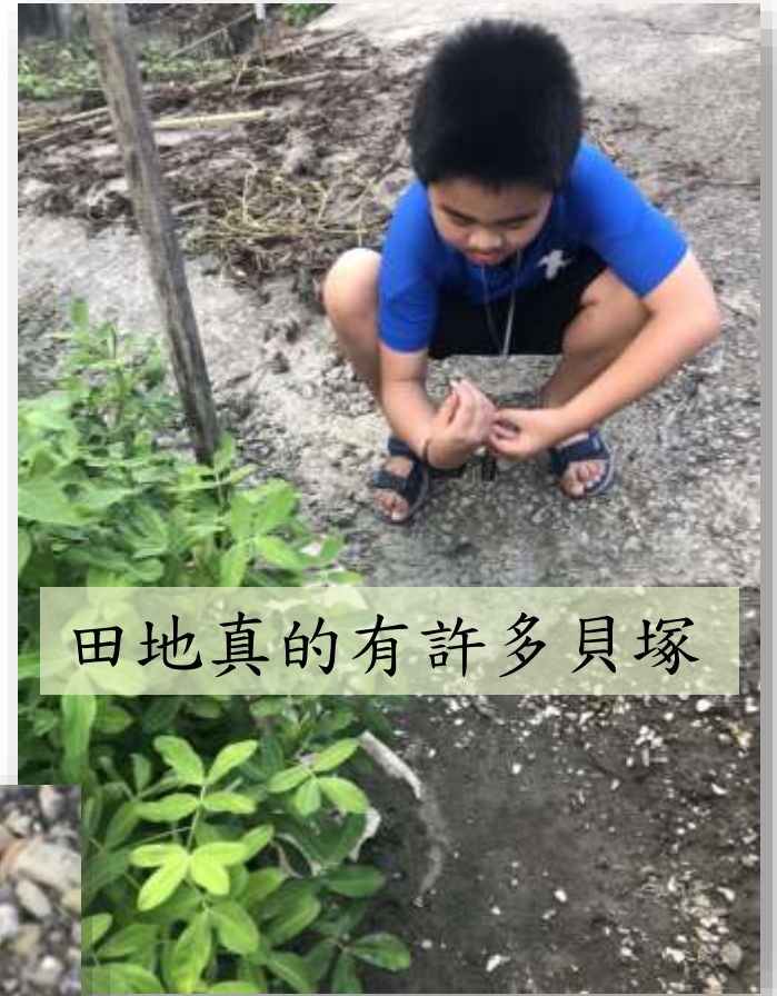
田地真的有許多貝塚