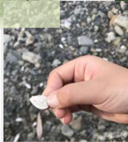
過去平埔族的貝塚