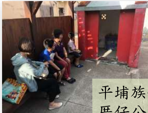
平埔族拜祖先的 厝仔公