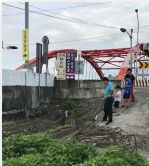
到新聞報導地點尋找 貝塚