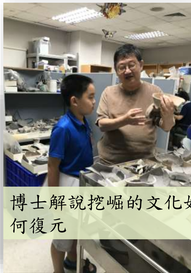
博士解說挖崛的文化如何復元