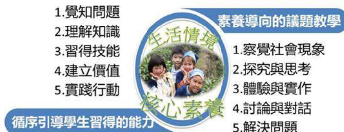
圖 1.2.1 議題的教與學

本次十二年國民基本教育課程以「自發」、「互動」及「共好」為基本理念，「核心素養」為課程發展主軸，並強調議題融入課程。議題融入課程可從不同領域/科目角度對議題加以探究、分析與思考，提供跨領域整合的學習機會，彰顯問題的情境性與觀點的多元性。在進行時，宜循序引導學生覺知問題，掌握議題的知識理解，將各領域所習得的學科知能加以整合與應用，並培養學生對生活情境問題的分析與解決能力。另則藉由議題的可討論性，協助學生澄清價值，建立信念，且提供問題解決的學習與實踐機會，進而促使學生產生行動（參見圖 1.2.1）。由上所述，可知議題因其特性，將讓議題融入課程擴充原有領域/科目之學習，對於素養導向課程之落實，有加乘之效果。