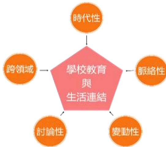
圖 1.1.1 議題的特性