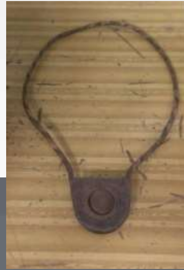
古老的電氣路牌套