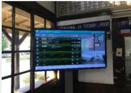
站內公車到站顯示器