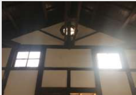
站房上方的牛眼窗及方窗