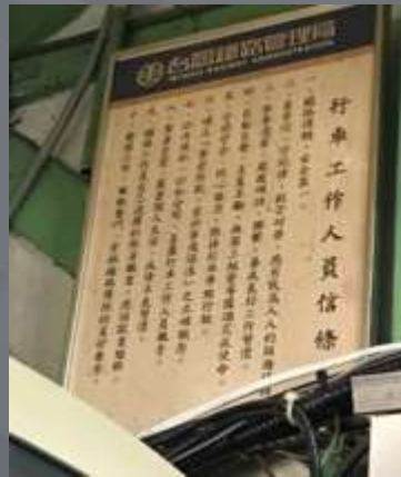
行車工作人員信條