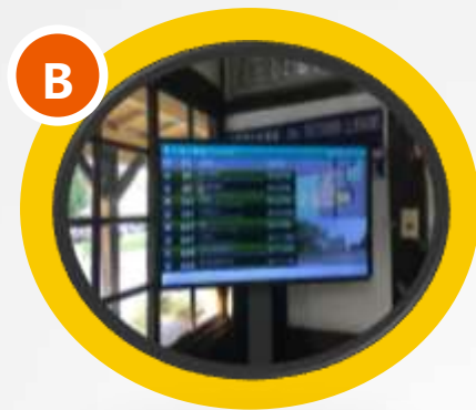
古老與現代的交集

但實際建築木頭上的油漆都已斑駁，年久失修，木質廊柱更因為嚴重腐蝕，缺少維護，實為可惜。