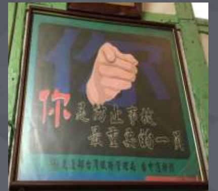
站長室的古老海報