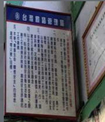
站長室內的工作指標