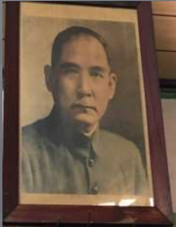
站長室的國父遺像