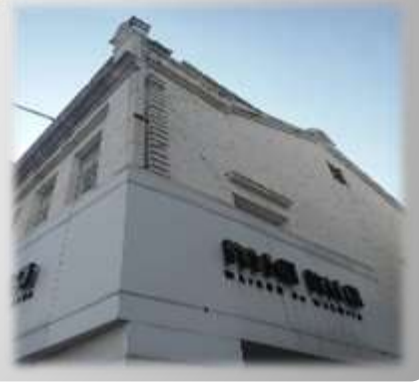
銀宮戲院旁的建築