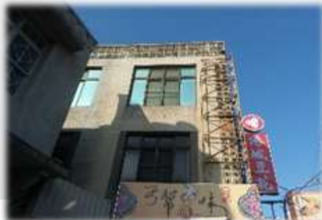
銀宮戲院旁的建築