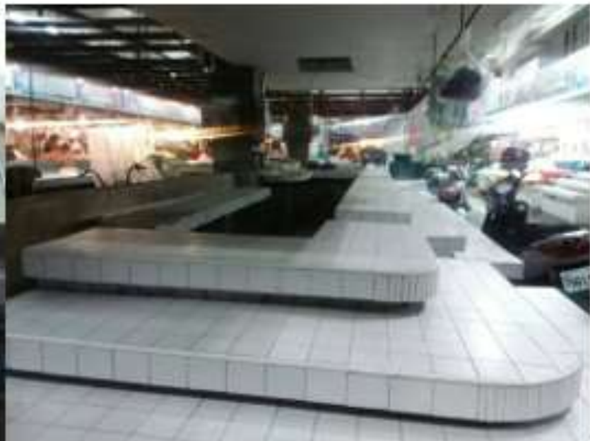
市場內閒置的攤位