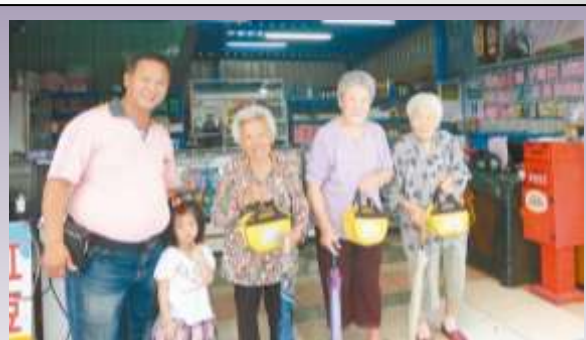
彰化市福田社區老人家中午帶著便當袋到社區共餐