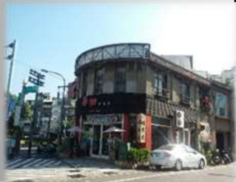
銀宮戲院前的建築