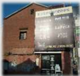
銀宮戲院附近的建築