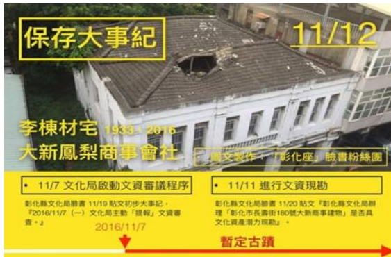
（圖1）老屋保存與拆遷議題的討論

去年彰化市有一些有歷史意義的老房子被拆掉，一連串老屋保存與拆遷議題的討論及報導（圖1），引起我們開始注意起彰化市老屋的議題。上社會課時，老師提到老屋可以新用，彰化市有些老屋已經被保存下來，並幸運的被再造與活化，而「王長發商號」（圖2）就是其中一個例子。它原本是被拆掉的老房子，但被及時買下，並加以改造，重新帶給人們煥然一新的感覺，現在已成為賣滷味和很受歡迎的打卡地點。所以我們決定進行「王長發商號」老屋活化案例的研究，進一步瞭解彰化市在地老屋的保存以及歷史意義與再利用的情況，並希望對彰化市老屋新用探討未來持續發展可行的方式，讓老屋繼續活在新的時代。