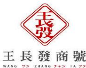
王長發商號的logo（圖九）