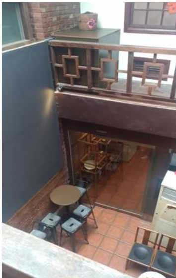
賣滷味和飲料的空間 （圖六）

前面為賣滷味和飲料的空間（圖六），中間利用天井（圖七）採光，後面為客人休閒的空間，二樓則是藝文展示空間（圖八）和陽台（可望到對面）。