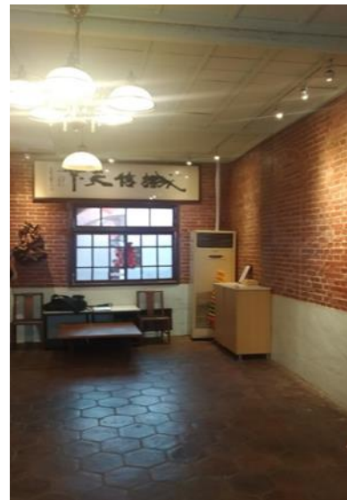
二樓的藝文展示空間 （圖八）