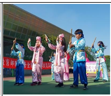
圖 17 民俗體育