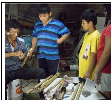
圖 15 拜訪耆老