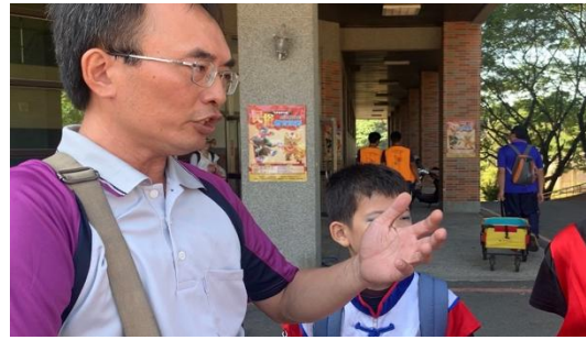
圖 14 實地採訪藝陣老師

於 2019 年 11 月 17 日上午 10:00 訪談車鼓陣藝師林○佑老師，訪談時間約為 40 分鐘，透過訪談討論錢龍七響車鼓陣納入學校課程的影響(圖 14)。