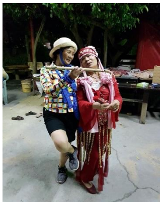
圖 12 社區居民練跳車鼓

「因為失傳 50 年，說真的這種東西，在別的這地方找不到，那為什麼要推展車鼓，是因為在跟耆老他們講的時候，他們的眼神突然亮的，鄉下地方的老人作息比較單純，但當他們聽到車鼓眼睛是亮的，你會覺得很感動，很想要把他們的熱情找回來，所以是這樣推展出來的。」