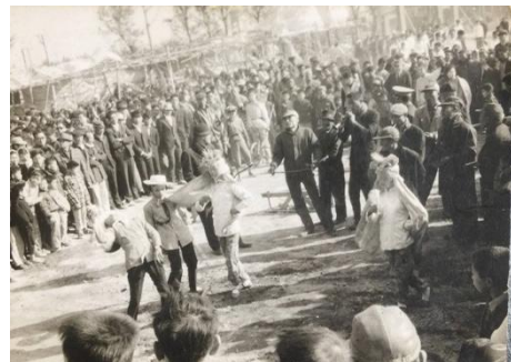
圖 8 日治時期溝頭車鼓

「車鼓陣的歷史應該超過九十年，我的岳父曾經指導過小朋友跳車鼓，是在地第一梯的車鼓陣，那些學生現在應該已經超過九十歲了，追溯起來應該是在民國二十年左右，也就是日治時期就有了這個車鼓陣 (圖 8)。」