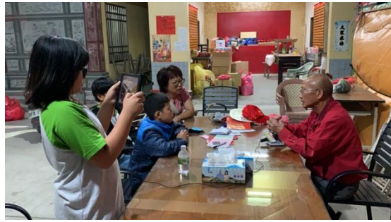
圖 7 實地採訪廟祝

於 2019 年 10 月 18 日下午 17:30 訪談彰化縣溝頭天和宮廟祝林○森老先生 (圖 7)，訪談時間約為 40 分鐘，透過訪談瞭解在地錢龍七響車鼓陣的歷史緣由。