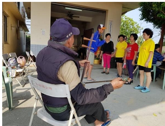
圖 13 社區長輩搭配演奏二胡