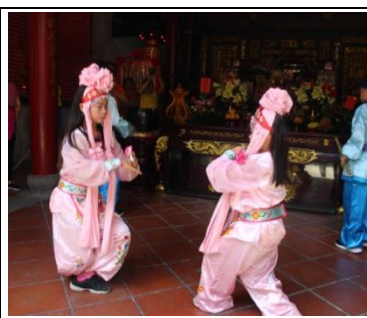
圖 16 廟前展演