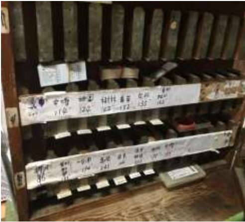
圖 9: 存放硬票的老票櫃

我們也問站員珍貴的硬式車票會不會再向票務中心請領，但站員回答：「因為本站的硬式車票庫存還有非常非常多，有的票