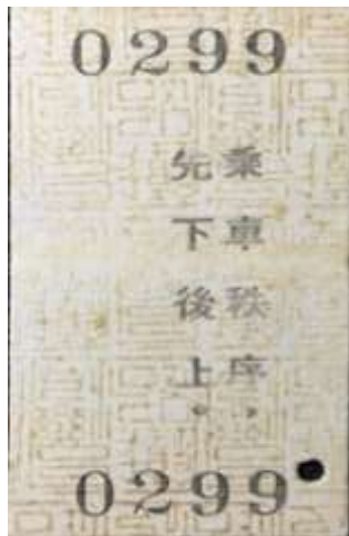
圖 6-5: 車票防偽紋

在民國八十幾年以前印的硬票都印有防偽紋，要用紫外線燈才能看見，但有硬票因為印製年代久遠而跑出來。