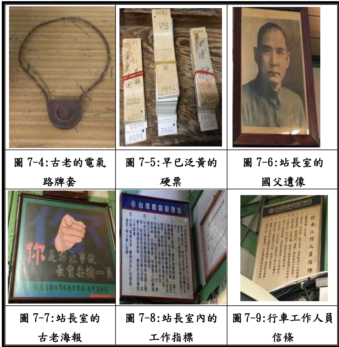
圖 7:車站內的老古董