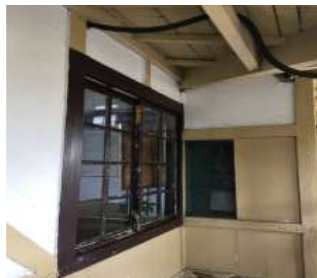
圖 2: 掉漆的建築

最近也開始將古老的木頭樑柱上漆，連在此上班的員工都希望能將辦公室重新上漆(圖 2)，古蹟車站破損不堪，也因此躍上了新聞版面，希望日南站能早點恢復古老的風貌。