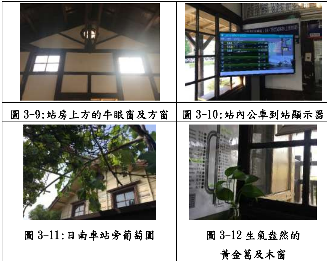
圖 3: 日南車站目前的樣貌