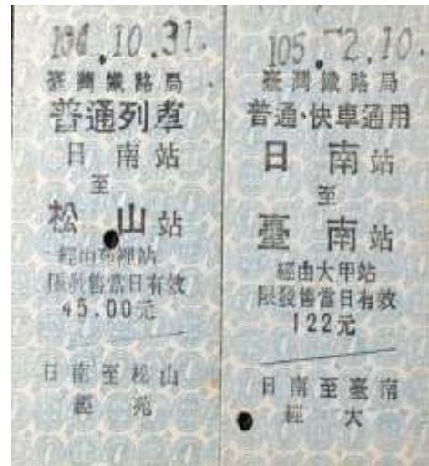
圖 6-2: 票面價格不同