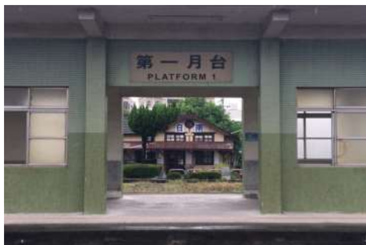
圖 4:美麗的日南車站

有人覺得日南是一個非常可愛的名字，那它的名字到底是怎麼來的呢？它的名字是從平埔原住民道卡斯族日南社的漢譯很詩情畫意，尤其是大冬天時整個車站內外的冷颼颼的非常寒冷那時的車站更讓人覺得超級漂亮的，連拍出來的照片也很棒。