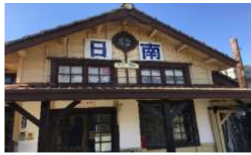
圖 3-2:日南車站後面照