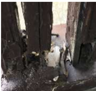
圖 1: 損壞的基座

因為站房建築優美於中華民國 92 年 5 月 9 日正式指定為縣定古蹟，又在中華民國 98 年 12 月 25 日因應臺中縣市合併而更改為 市定古蹟 ，和苗栗的談文站、大山站、新埔站和台中的追分站合稱為「海線五寶」，至今都有許多 鐵道迷及觀光客到這些車站收集車票、拍照或者是蓋紀念戳章作紀念 ，而且在日南站旁邊還有一間早期放置道班工維修鐵道器具的道班工房，及很久以前