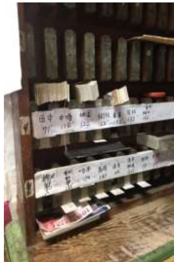
圖 7-1: 古老的木製票櫃