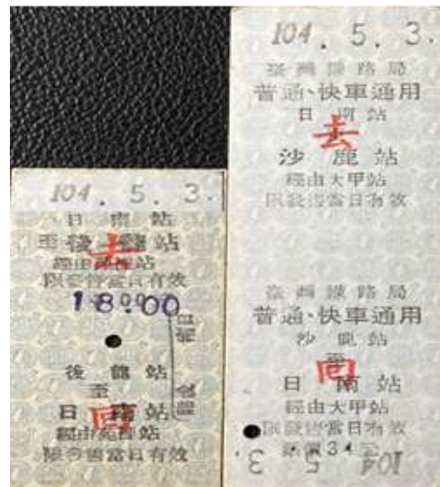
圖 6-4: 去回票的不同

大家現在看到車票都會看見票價欄印著「票價 133 元」，但以前的車票可是只有印「133 元」呢！