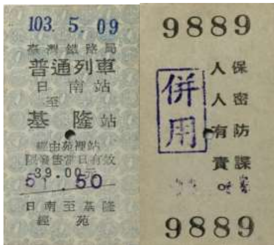
圖 6-1: 反共標語票