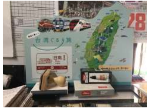
圖 11:日南車站紀念章

站員無奈地回答說:「多多少少還是有,今天發現我們站內的紀念章(圖11)少了一枚,應該是被昨天的旅行團帶走了,於是我只好把它拿進來放,紀念章才不會越來越少。」