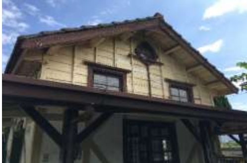
圖 3-3:日南車站側面照