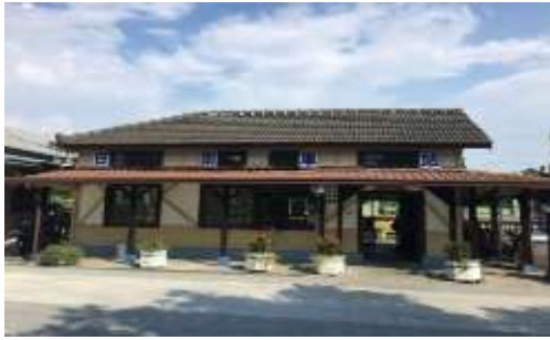
圖 3-1:日南車站正面照