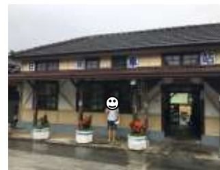
圖 17:與日南車站合照

最後謝謝協助這次獨立研究的老師辛勤教導、日南車站的 副站長、站員叔叔 分享車站內的故事及物品，及好幾週辛苦帶著我前往日南車站的 爸爸、媽媽 ，大家都不厭其煩解決我所遇到的問題。萬分感謝！