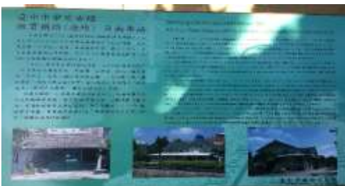
圖 3-7:日南站的介紹牌