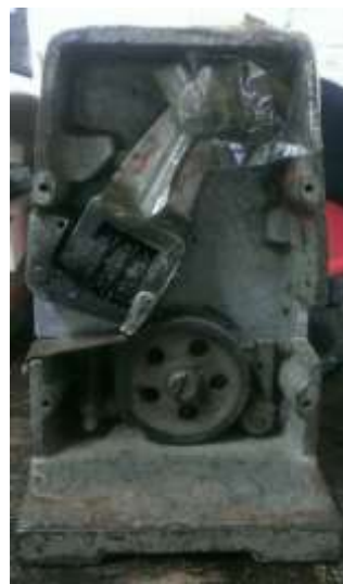
圖 7-2: 車票軋日機 (1)