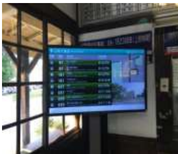
圖 14:古老與現代的交集

木柵, 在車站建築上仍看得到牛眼窗, 是海線早期站房特色,但實際建築木頭上的油漆都已斑駁(圖13), 年久失修, 牆面斑駁、木質廊柱更因為嚴重腐蝕, 缺少維護, 實為可惜。