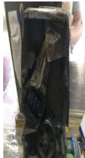
圖 7-3: 車票軋日機 (2)