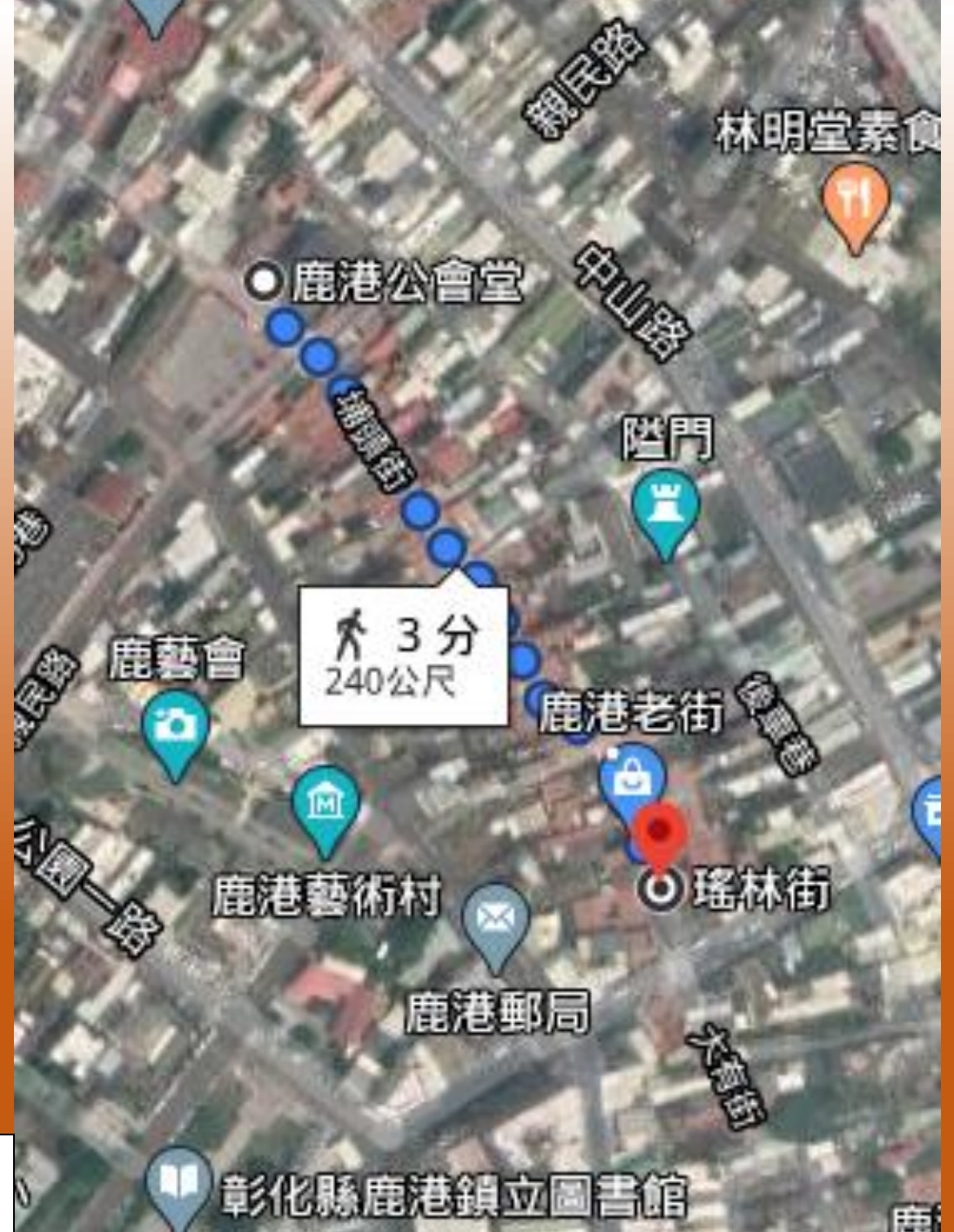
鹿港老街衛星地圖