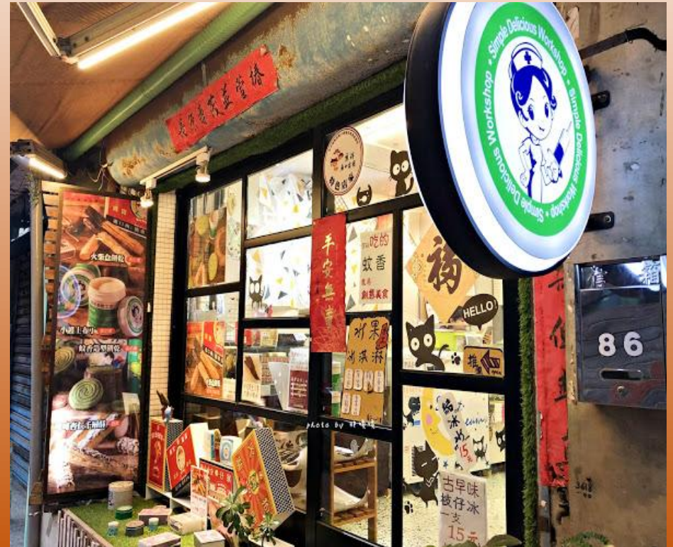
簡單美味工坊-臨時取消